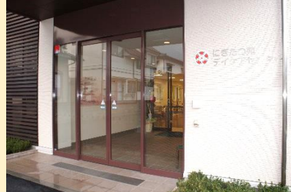
2012年10月 デイケアセンター移転