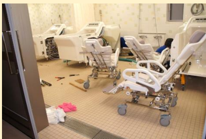
2012年10月 入浴機器搬入