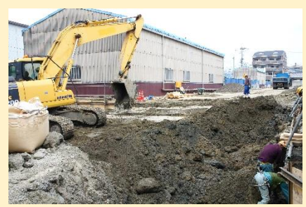
2012年4月 建築工事開始