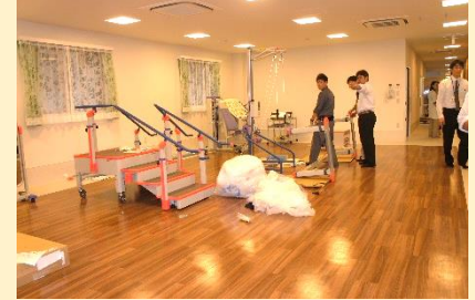
2012年10月 リハビリ機器搬入